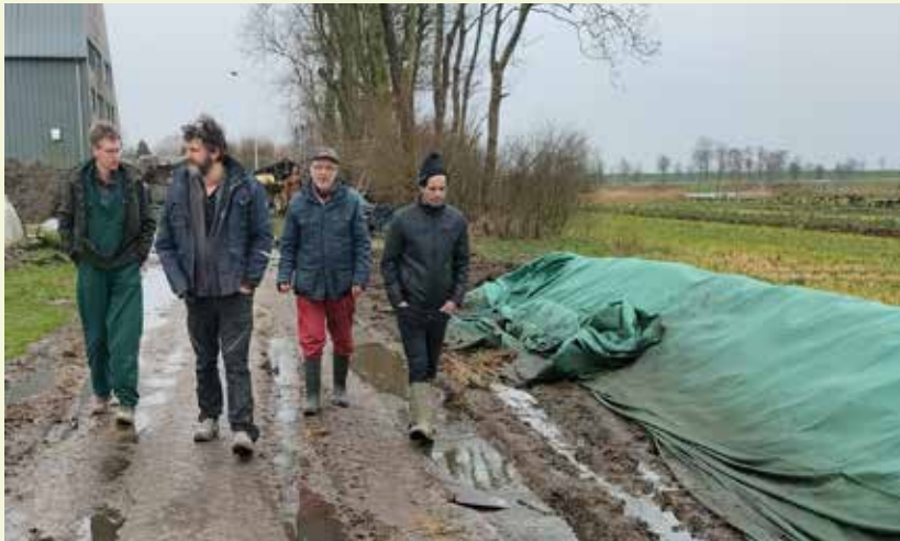
Rechts: CMC compost.

In de CMC methode wordt het materiaal in de eerste twee weken zeer regelmatig machinaal gemengd en direct weer afgedekt met compostdoek. Dit mengen vindt plaats zodra het gemeten CO 2 -gehalte in de hoop meer dan 16% is en de temperatuur meer dan 60-65 °C. Er wordt gedurende het proces geen nieuw materiaal bijgevoegd; alleen water als de hoop te droog wordt. De samenstelling van het uitgangsmateriaal is dus sterk bepalend voor de intensiteit van de behandeling. "De CMC compost is in