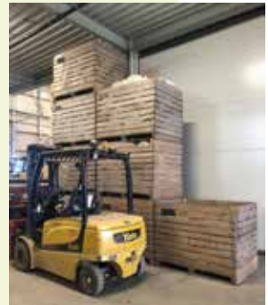
Netjes en enkele kisten bereikbaar.