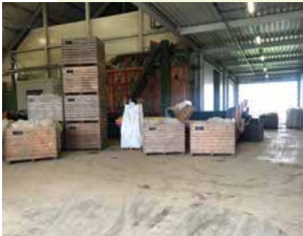
Kisten schots en scheef.

Zo heb ik een medewerker gevraagd om in de schuur de kisten netjes neer te zetten. Dan zie ik opeens dat de kisten allemaal keurig in de hoek gezet zijn, dicht op elkaar. Maar morgen komt er een vrachtauto, die geladen moet worden met een aantal van die kisten en dan is dat niet zo handig dat ze allemaal dicht op elkaar staan en de kisten die nodig zijn juist niet vooraan staan."