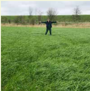
Hier was de sloot.

“We hebben een aansluitend gangbaar perceel aangekocht. Ons perceel loopt nu door tot aan de weg. De sloot ertussen hebben we dichtgegooid. Daar is beslist biodiversiteit verloren gegaan. Ik had toen het gevoel dat ik iets moest doen, maar ik wist nog niet wat. Maar ik wist wel dat er wat zou gaan gebeuren. We hebben uiteindelijk aan het uiteinde van die dichtgegooide sloot een tweede poel gegraven. Nu ligt aan de twee buitenkanten van het bedrijf elk één poel. Die poelen waren voor mijn gevoel nodig om balans in het bedrijf te brengen of te houden. De biodiversiteit van het perceel zelf is in ieder geval ook al toegenomen door onze bewerkingswijze.”