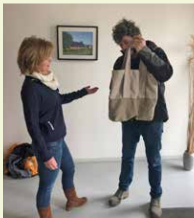
Een mooie linnen tas.