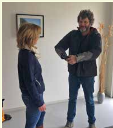
En daar sta je dan met je boodschappen!