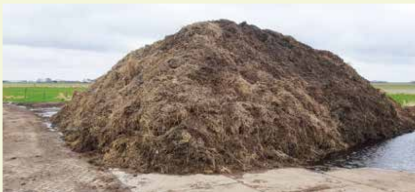
Ruim een maand later, na omzetten.