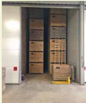
Netjes opgeruimd, kisten moeilijk bereikbaar.