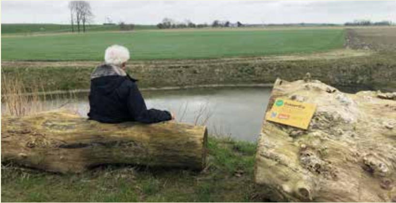
Poel west, met zicht op de boerderij.